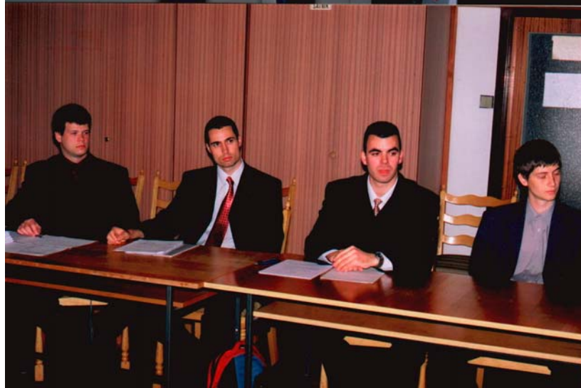
Prezentácia príspevkov v sekciách.