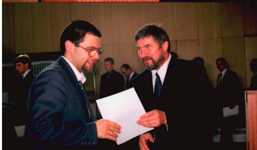
Slávnostné odovzdávanie ocenení.